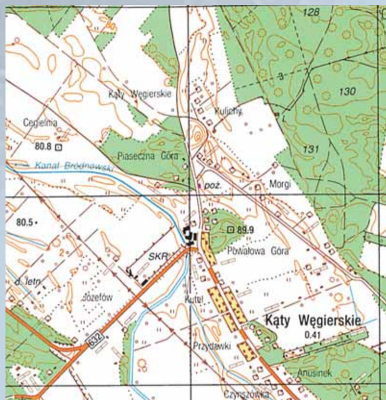
Fragment mapy topograficznej z nazwami kolonii w Kątach Węgierskich m.in. Kulichy